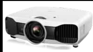
76 EPSON EH-TW9100W La nueva generación LCD