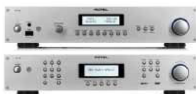
54 ROTEL RA-12+RT-12