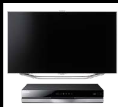
80 SAMSUNG BD-E8500+UE46ES8000S Tecnología y clase