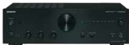
50 ONKYO A-9050