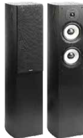
66 VIETA VH-HA100+VH-CD060+L'ACORD 40