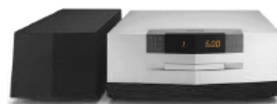
62 TAD D600