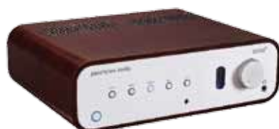
52 PEACHTREE AUDIO DECCO65